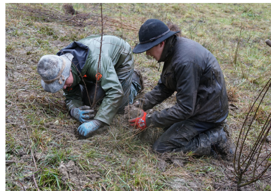
Garten gemeinsam mit Schüler/-innen anlegen