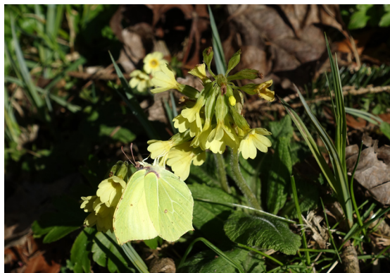
Beobachtung von Pflanzen und Tieren ermöglichen