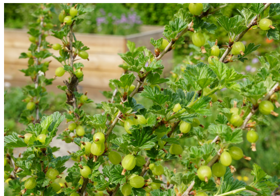
Beerensträucher zum Pflücken