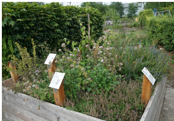
Reich bepflanzte Beete mit beschrifteten Pflanzenarten