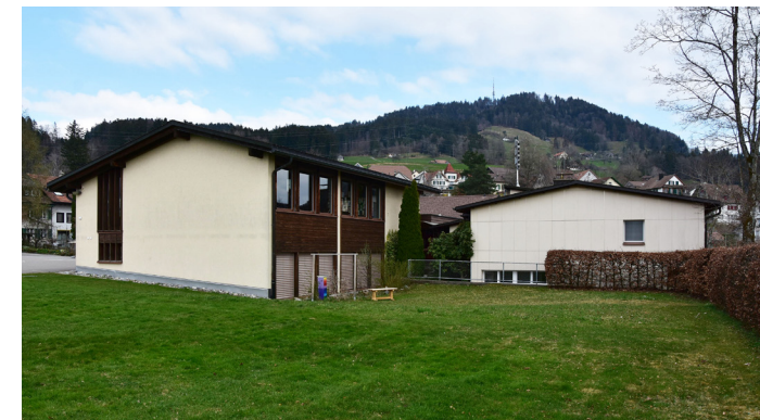
Vorgesehener Standort Lerngarten - Blick aus Westen